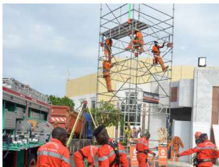
DES ATELIERS PRATIQUES