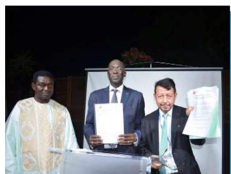
CHARTRE DE PARTENARIAT CSS / CRAMIF