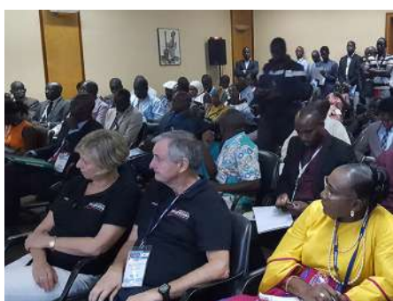
SALLES DE CONFÉRENCES COMBLES