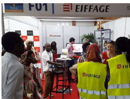
DES JEUX CONCOURS SUR STAND