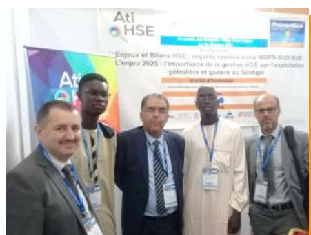
1ÈRE JOURNÉE NATIONALE HSE ÉCHANGES SÉNÉGAL-MAROC