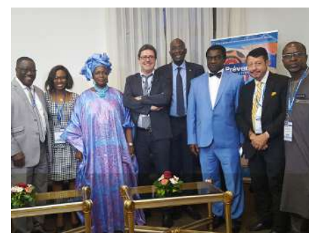
CONFÉRENCE DE PRESSE DE CLOTURE