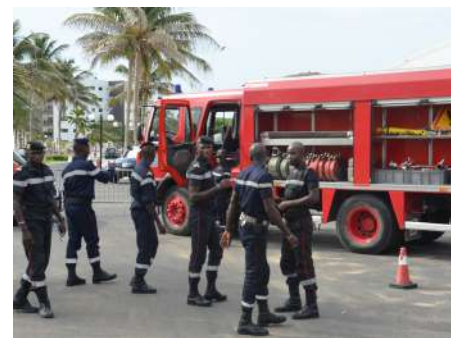
DES ATELIERS PRATIQUES