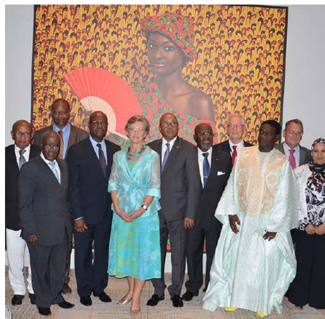
Pays représentés : Autriche, Belgique, Burkina Faso, Cameroun, Canada, Union des Comores, Côte d'Ivoire, France, Guinée Bissau, Liban, Madagascar, Mali, Maroc, Bureau du Québec, République Démocratique du Congo, Sénégal, Suisse, Tchad, Délégation Générale Wallonie Bruxelles