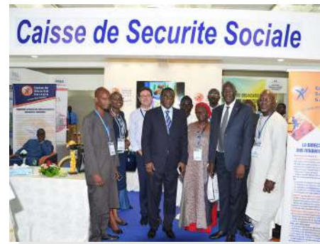
LA CAISSE DE SÉCURITÉ SOCIALE DU SÉNÉGAL, PARTENAIRE MAJEUR