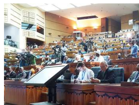
UN LARGE PUBLIC ATTENTIF